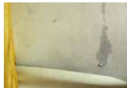
Poškození stěn v interiéru po vniknutí vody