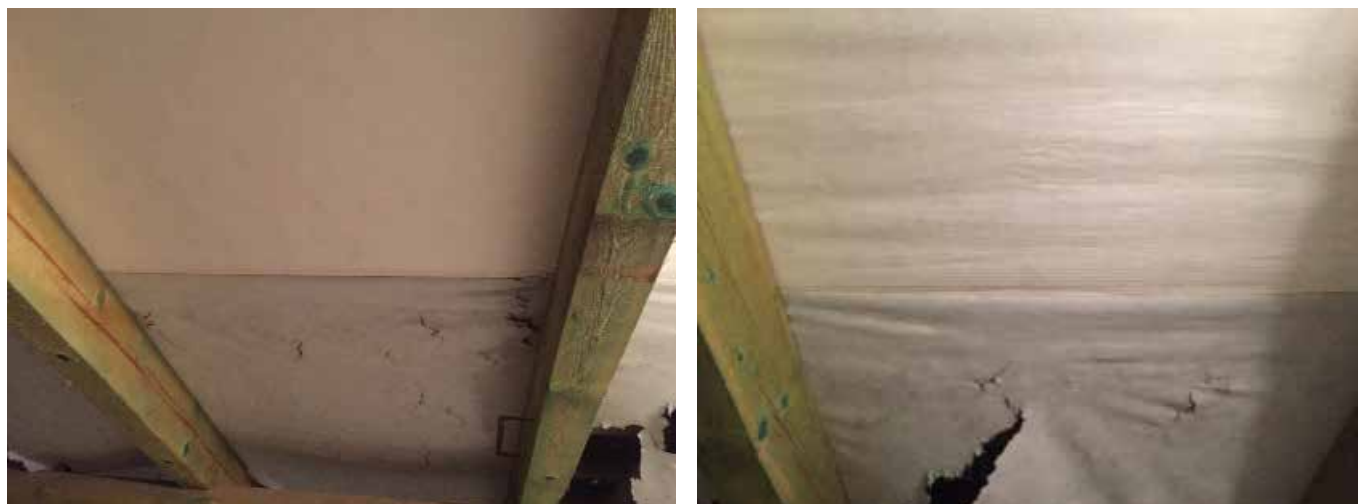
Obrázky: dole: 3vrstvá mikroporézní fólie 135 g/m 2 , nahoře: Tyvek®

Výsledky testu potvrzují i další praktický příklad. Přímo unikátní reálný test, kdy díky náhodě, byla na jedné střeše použita vícevrstvá fólie 135 g/m 2 a Tyvek® Solid. Primární volbou byla vícevrstvá fólie, avšak kvůli chybějícímu materiálu byla narychlo použita i jedna role Tyvek® Solid. Jedná se o střechu instalovanou v roce 2002. Tak se stalo, že tyto dva rozdílné produkty měly stejné umístění, podmínky a stejnou dobu stárnutí. Po 14 ti letech pořízená fotografie ukazuje jasný rozdíl v kvalitě fólií!!! Pro více informací o této střeše se můžete podívat na naši stránku www.tyvek.cz/teststrech .