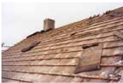
Zborcení konstrukce budovy působením hub a plísní